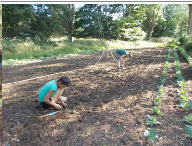
Repiquage au cordeau