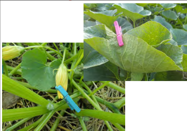
La veille de polliniser : le soir fermeture des fleurs mâles (scotch ou pince à linge) et balisage (pince à linge visible sur les grosses feuille)