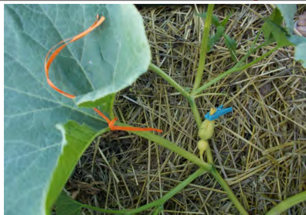
La veille de polliniser : le soir fermeture des fleurs femelles (pince à linge) et balisage (raffia) pour gagner du temps le lendemain.

Voici les étapes à réaliser en deux temps ;