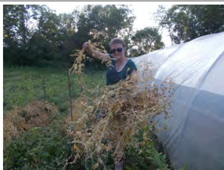
Bravo, dernière mission accomplie avant les pluies !