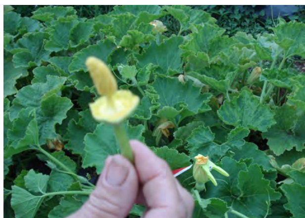
Pollinisation manuelle le matin : Fleur mâle au premier plan, dont on a arraché les pétales, fleur femelle fermée au second plan