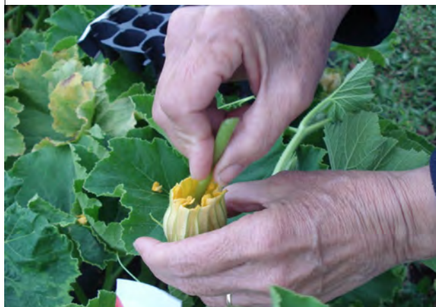
Pollinisation : On badigeonne le pistil avec environ 3 fleurs mâles pour 1 fleur femelle. Ici la partie supérieur des pétales a été coupée.