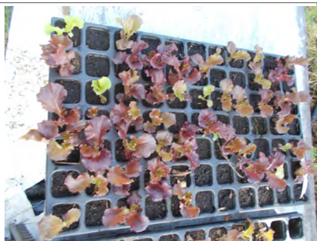
Quelques hors type (verte) seront à manger