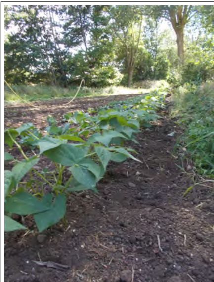
Les haricots beurre Major, Magnifiques !

Quant aux tomates Gem'state , elles ont prouvé être résistantes. Elles ont attendu un repiquage tardif et malgré leur port trapu resté petit, elles sont entrées en fructification.