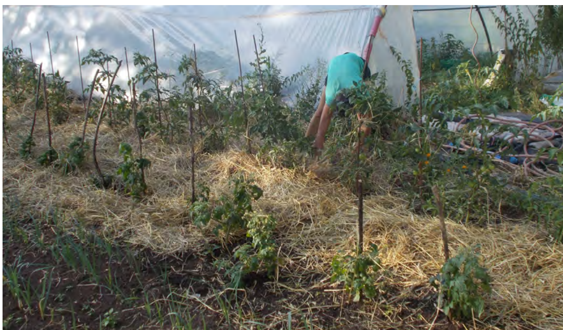
Et voilà le travail !