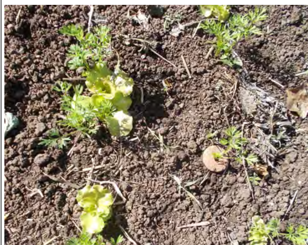
Semis direct laitues et carottes