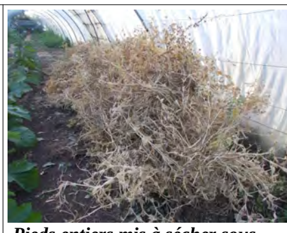
Pieds entiers mis à sécher sous serre en attendant stockage au sec.