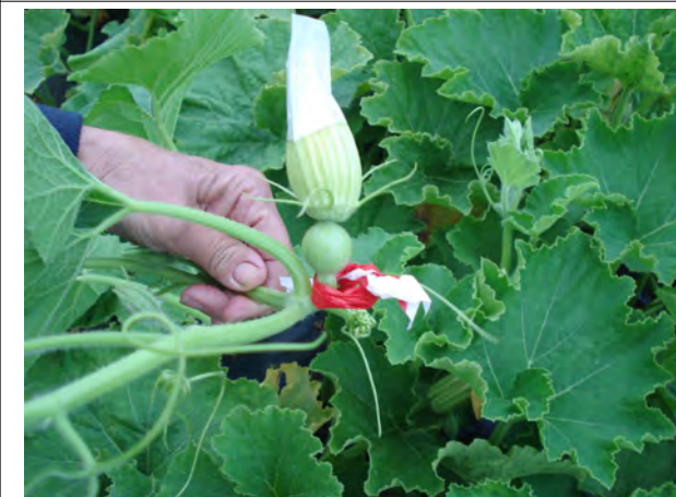
Repérage des fruits fécondés (rubalise ou raffia+ « gravure » à l'ongle ou pointe de couteau)