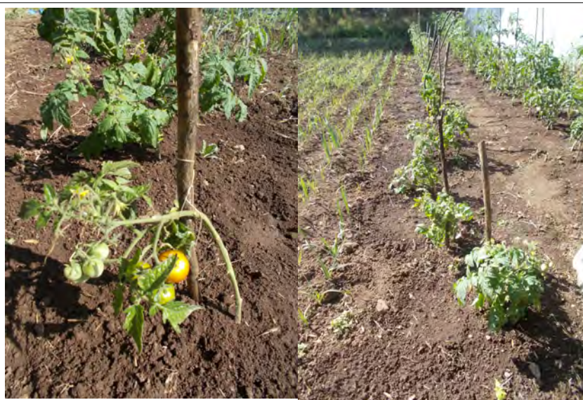
Les tomates Gem State petites mais costaudes !