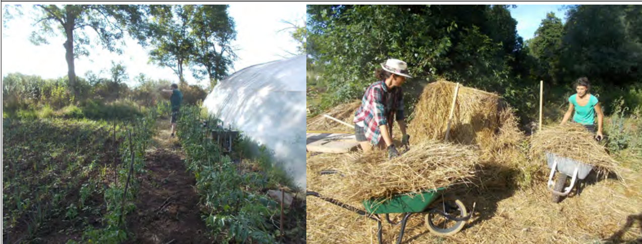
Paillage des tomates. Nous paillons également les allées pour nous éviter de futurs désherbage.