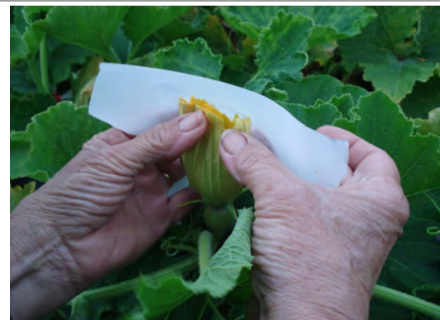
Fermeture de la fleur fécondée ( scotch plus hermétique sinon pince à linge)